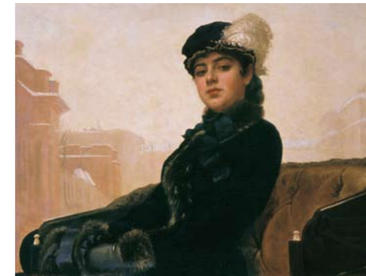
Iwan Nikolajewitsch Kramskoi