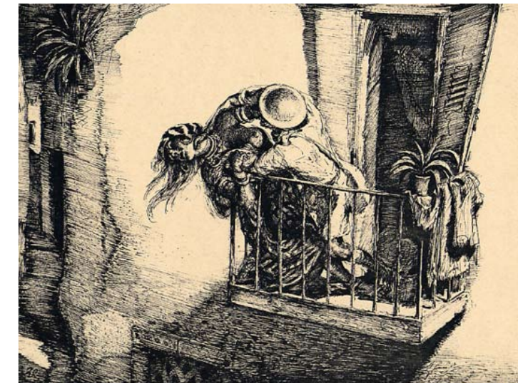
Andreas Paul Weber